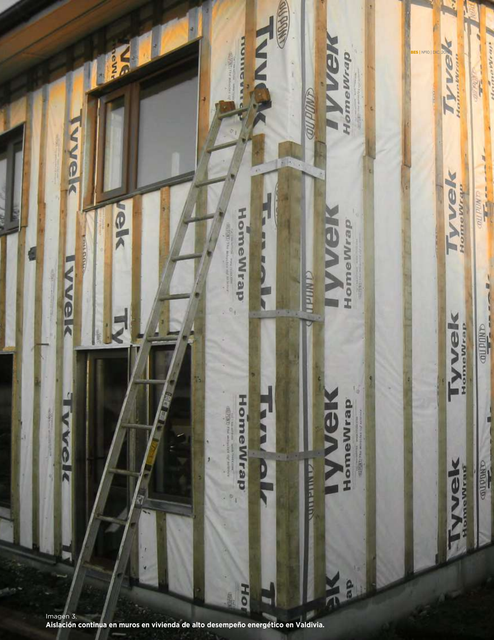
Imagen 3. Aislación continua en muros en vivienda de alto desempeño energético en Valdivia.