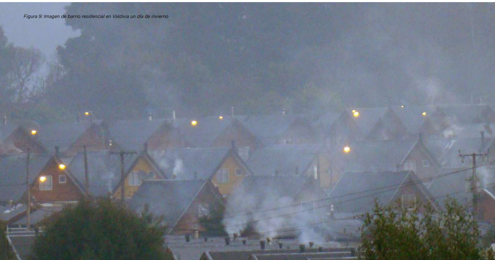
Figura 9: Imagen de barrio residencial en Valdivia un día de invierno

i) Establecer prioridades entre los elementos de aislación que se van a reacondicionar. Actualmente, es muy