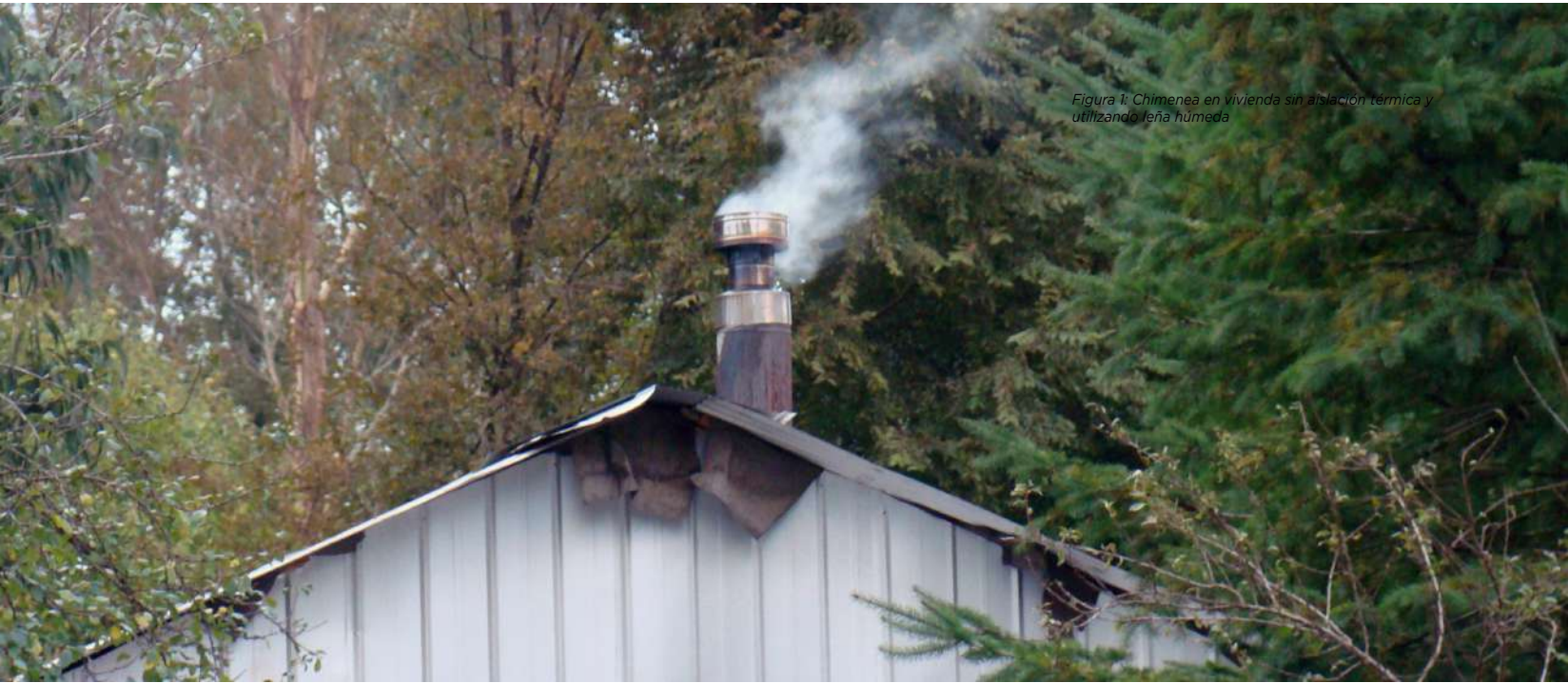
Figura 1: Chimenea en vivienda sin aislación térmica y utilizando leña húmeda

específicamente entre las ciudades de Temuco y Puerto Montt, demostraron una incidencia más alta de bronquitis crónica en la población en general, y una incidencia significativamente más alta de enfermedades cardiovasculares en las personas mayores durante los meses de invierno (Gómez-Lobo et al. , 2006). Los hogares de la zona centro y sur del país están expuestos además a bajas temperaturas interiores. Si bien se recomienda mantener la temperatura interior de las viviendas entre 18°C y 21°C, estudios demostraron que la temperatura interior en los hogares ubicados entre las ciudades de Concepción y Puerto Montt en invierno oscilan entre 14,3°C y 16,5°C (Bustamante et al. , 2009). Esto ocurre a pesar de la alta demanda de leña, debido a que las viviendas tienen muy bajo nivel de eficiencia energética. Por lo tanto, las construcciones que tienen un bajo nivel de aislación térmica afectan la salud de las personas de dos maneras distintas: emitiendo grandes concentraciones de material particulado y manteniendo bajas temperaturas.